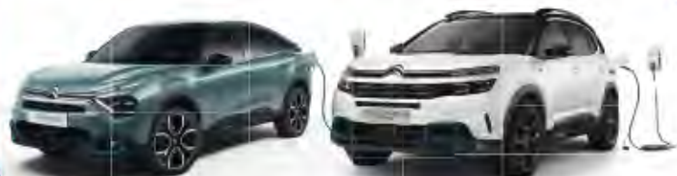
NEW CITROËN C4 & E-C4 100% ÉLECTRIQUE