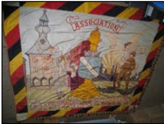
Nous présentons une vue du drapeau avant sa restauration.

Pour la SRAHV et le musée régional Jean-Pierre Lensen