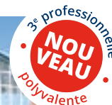
Institut Saint-Joseph Technique & professionnel industriel