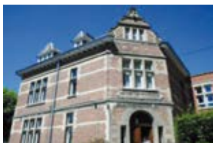
Institut du Sacré-Cœur Technique & professionnel non industriel