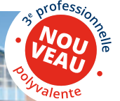
Institut Saint-Joseph Technique & professionnel industriel