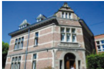
Institut du Sacré-Cœur Technique & professionnel non industriel