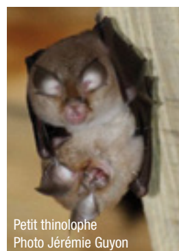
Petit thynlophie

L'autre enjeu du projet est la plantation de haies, prise en charge par le LIFE Prairies bocagères qui a notamment pour objectif, en Famenne, de restaurer des territoires de chasse attractifs pour le petit rhinolophe. Pour ce faire, 3 600 m de haies seront plantés sur le site. Pour le petit rhinolophe, ces éléments sont placés de manière à créer des zones de liaison à proximité du gîte. La mise en place de ces haies aura aussi un impact positif pour d'autres espèces de chauves-souris, les oiseaux typiques du bocage, les petits mammifères, les amphibiens et les reptiles.