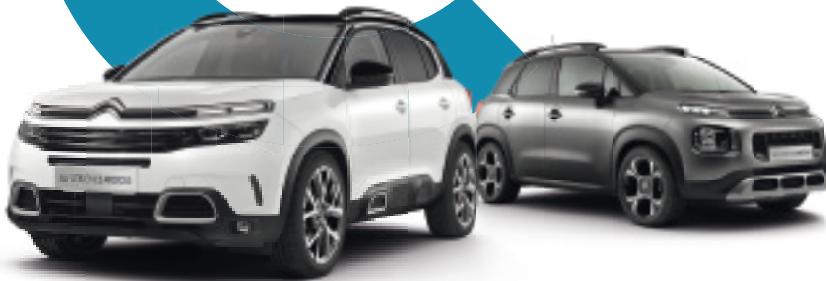
SUV CITROËN C5 AIRCROSS

JUSQU'À 100% DES OPTIONS OFFERTES SUR LES CITROËN DE STOCK (4)