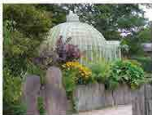
Les vivaces soulignent de manière remarquable le mur.

Ainsi on y trouvait des fleurs à foison qui finissaient par coloniser les moindres recoins.