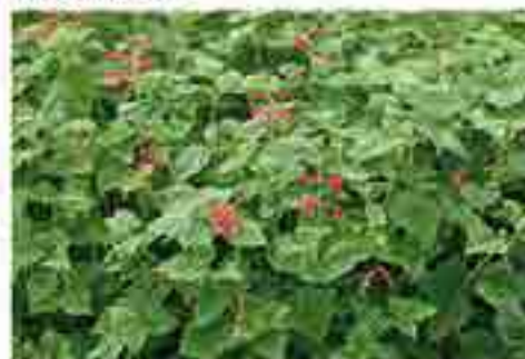
Ici un massif de sauge au parfum d'orange