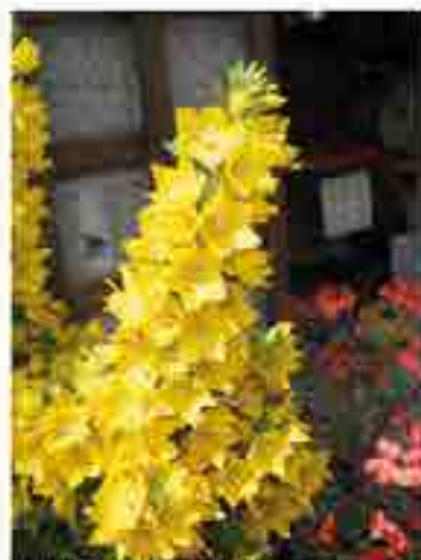
Haute florale de Lysimachie Lysimachia punctata

Les Lysimaches ( Lysimachia ) sont plantes vivaces solides et vigoureuses qui se développent bien dans la plupart des sols à l'exception des sols argileux. Elles demandent généralement de expositions ensoleillées ou mi-ombrées général.