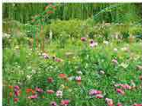
Flûte de Pavots au Jardin de Monet à Giverny.

Le jardin de nos grand-mères regorgeait de plantes et fleurs en abondance. Les plantes y étaient disposées en un magnifique fouillis organisé par ces dames avec l'aide de dame Nature.