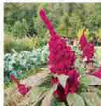
Ici, l'Amarante éléphant en sujet

Les Amarantes, ces plantes une fois dans leur élément se ressèment à tout vent. En toutes conditions. Il vous suffit alors de les transplanter lorsqu'elles sont encore jeunes à l'en- droit de votre choix. Notez, qu'il s'agit d'annuelles cultivées à la manière d'une vivace de par leur spontanéité.