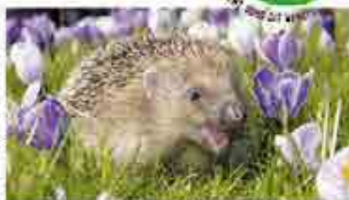
Surprise au jardin, un hôte apprécié du jardinier et redouté par les limaces

pour les futurs hôtes du jardin. Un fagot de bambous ou de branches pendu à un arbre, un bloc de bois perforé en différents endroits et couvert d'une ardoise attirerons nos amis à 6 pattes voir plus. Un tas de branches posées au sol ou quelques bûches un abreuvoir, attirerons musaraignes, oiseaux et hérissons qui feront le nettoyage de vos limaces et in- désirables. Souvent, en visitant votre jardin, vos hôtes vous amènent des surprises... des graines qui en germant créeront la surprise.