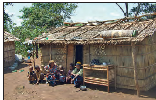
A l'Est du Cameroun, la pauvreté est extrême.

En 2018, 13 jeunes, encadrés d'une équipe d'adultes, repartiront au Cameroun, dans le diocèse d'Obala, ainsi que dans l'Est du Cameroun, où vivent des populations très pauvres. Encore une fois, avec nos amis africains, nous nous engageons dans des actions concrètes, principalement dans les écoles, car l'éducation est la base du développement.