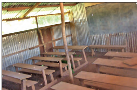
Une classe d'école, démunie de tout, accueille 100 élèves.

Nous avons aussi apporté des centaines de kg de vêtements, de matériel scolaire et de matériel médical remis en mains propres.