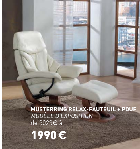
MUSTERRING RELAX-FAUTEUIL + POUF MODÈLE D'EXPOSITION de 3023€ à