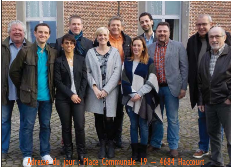
Adresse du jour : Place Communale 19 — 4684 Haccourt

Paiement souhaité pour le lundi 16/01 au N° de compte BE38 7925 5032 1872