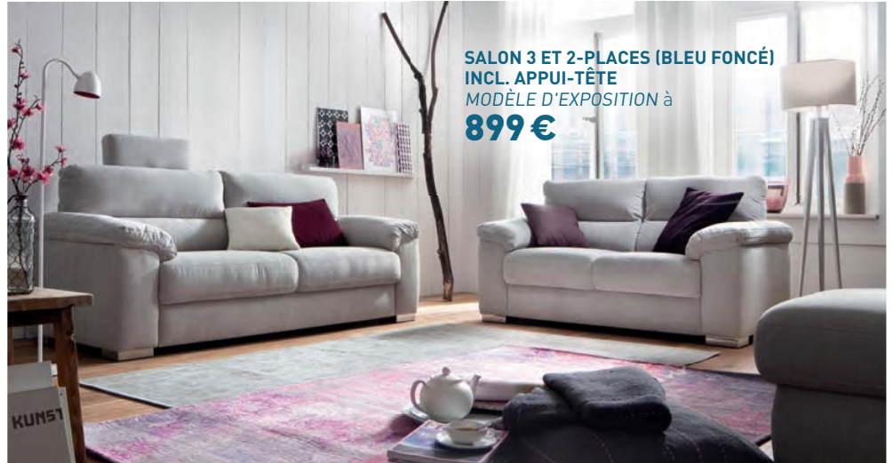
SALON 3 ET 2-PLACES (BLEU FONCÉ) INCL. APPUI-TÊTE MODÈLE D'EXPOSITION à 899 €