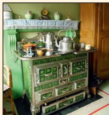
La cuisinière, année 1920.

0476/23.53.01 (Nathalie Hardy) ou 04/286.27.90 (Musée d'Eben)