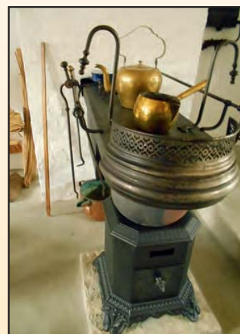
Le poêle de Louvain, début 20 e siècle.