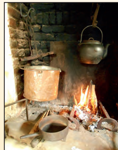
Marmite tripode et bouilloire en fonte, chaudron en laiton étamé.