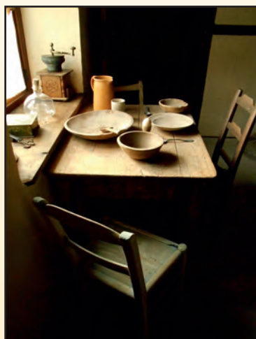
Vaisselle en terre cuite et en bois.