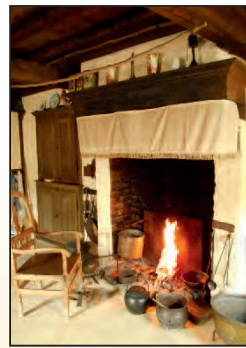
La cheminée au début du 19 e siècle

Contact : 0476/23.53.01 (Nathalie Hardy) ou 04/286.27.90 (Musée d'Eben)