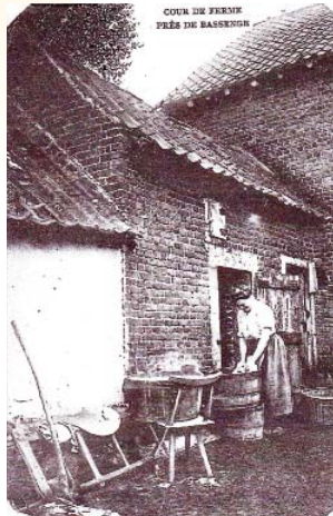
Bassenge (+- 1904) : La lessive dans la cour du moulin

DEKEN GELAESPLEIN 17 - 3770 RIEMST-VLIJTINGEN Tél. 012/45.31.04 - Fax 012/45.60.86