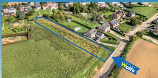
OREYE F.O. ÀPD. 166.000 €

Magnifique duplex neuf sur +/- 147 m 2 , 3 ch., liv. +/- 35 m 2 , sdb, sdd, belle terrasse, cave, électr. OK, PEB No. : 20230711508661, poss. achat emplac. parking !