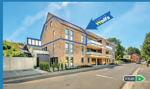
HEURE-LE-ROMAIN 298.000 € SS REG. TVA

Belle villa d'architecte sur +/- 200 m 2 hab., 4/5 ch., bur., liv. +/- 45 m 2 avec cuis. équ., jd +/- 459 m 2 , gar., électr. OK, PEB No. : 20230824019561, coup de coeur !