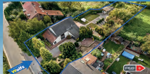
BASSENGE 265.000 €

Ancienne ferme avec dépend. à aménager et terrain, sup. tot. : 3.890 m 2 , hab. : 282 m 2 (+ dépend.), maj. de DV, PEB No. : 20230930003337, idéale pour divers projets !