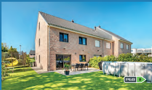
LIERS 375.000 € SS REG. TVA

De nombreuses familles attendent votre bien .... Contactez-nous !