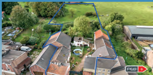
MILMORT F.O. àpd. 399.000 €

Parcelle à bâtir de 2.095 m 2 , pour villa 4 façades, faç. : +/- 18,5 m., libre de constructeur et d'architecte, belle situation campagnarde, région prisée !