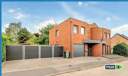
HERMÉE 489.000 €

Nvle construction de 2021, 3/4 ch., bur., liv. +/- 38 m 2 avec cuis. équ., jd +/- 400 m 2 , pann. photov., électr. OK, alarme, ss rég. TVA, PEB No. : 20210528504173, impecc. !