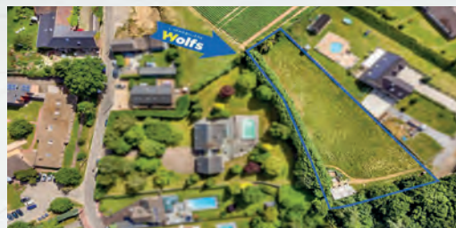
MILMORT 200.000 €

Superbe parcelle de 5.145 m 2 , faç. : +/- 100 m, prof. : +/- 50 m, poss. plusieurs lots (ss réserve d'autor.), libre de constr. et d'arch., en pleine campagne !