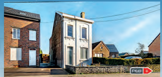
VOROUX-LEZ-LIERS F.O. àpd. 199.000 €

Vaste surface commerciale sur +/- 400 m 2 (gar./atelier, pièce lavage, bur.) et 2 apparts, jardin, parking, 33 pann. photov., alarme, nbrses poss. d'affectation !