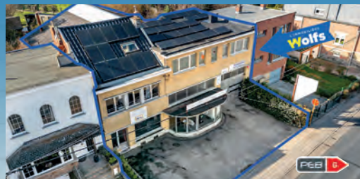
ROCOURT 550.000 €

2 surfaces commerc. (snack +/- 30 m 2 et garage/showroom +/- 300 m 2 ) + 1 appart. de standing 3 ch., alarme, PEB No. : 20200213003653, 62 pann. photov. (2021) !