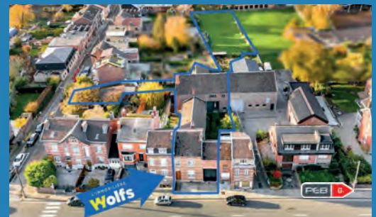
VISÉ 650.000 €

Charmante maison, 3 gdes ch., cuis. sup.-équ., liv. +/- 43 m 2 , jd aménagé, 2 gar., car-port, DV, nv ch. c., 39 pann. photov., PEB No. : 20230220033037, impecc. !