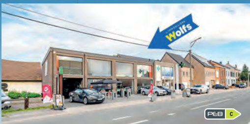
JUPRELLE F.O. àpd. 795.000 €

Maison (min. 4 ch.), + dépend. à amén. +/- 500 m 2 + terrain (accès par autre rue), cour +/- 140 m 2 , sup. tot. : 3.061 m 2 , DV, PEB No. : 20140522015483 !