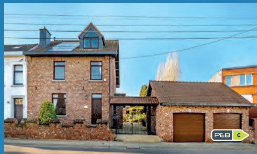
VOTTEM F.O. àpd. 419.000 €

Villa semi-mit., 4 ch., liv. +/- 43 m 2 avec cuis. équ., jardin, garage, sup. tot. : +/- 600 m 2 , DV, ch. c., alarme, PEB No. : 20201103023288, belle situation !