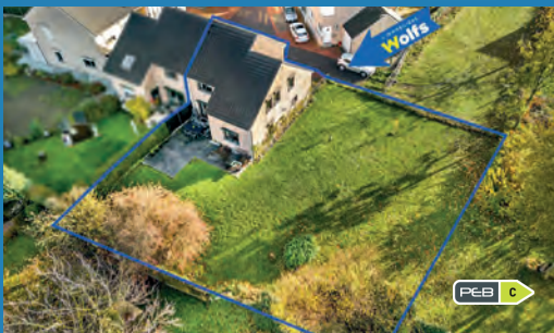
ALLEUR 395.000 €

De nombreuses familles attendent votre bien .... Contactez-nous !