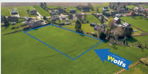
VILLERS L'ÉVÊQUE 399.000 €

Maison, 3 ch., cuis. équ., beau jardin +/- 500 m 2 , espace parking couvert, R.C. : 334 €, DV, électr. OK, PEB No. : 20210825017663, vue sur les champs !