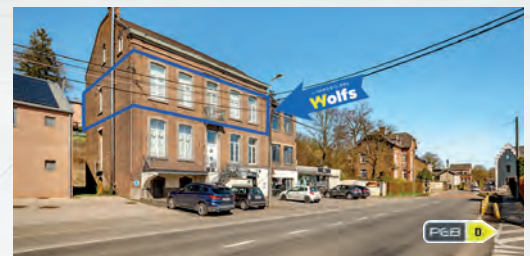
ROCLENGE-SUR-GEER (BASSENGE) 215.000 €

Belle parcelle à bâtir, au fond d'une allée com., à proxi. des facilités, sup. tot. : +/- 2.600 m 2 , plat, R.C. : 20 €, libre constr. et d'archi., à découvrir !