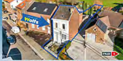
VOROUX-LEZ-LIERS à pd. 219.000 €

Vaste surface commerciale sur +/- 400 m 2 (gar./atelier, pièce lavage, bur.) et 2 apparts, jardin, parking, 33 pann. photov., alarme, nbrses poss. d'affectation !