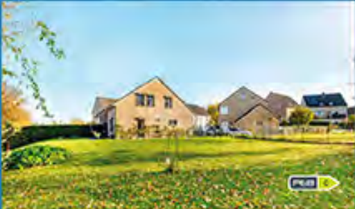
ALLEUR 395.000 €

De nombreuses familles attendent votre bien .... Contactez-nous !