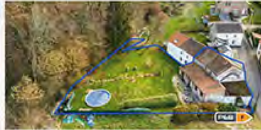
WONCK 210.000 €

Appart. sur +/- 90 m 2 au 5 ème étage, 2 ch., liv. +/- 40 m 2 avec cuis., cave, balcon, gar., DV PVC, ch. c. commun, PEB No. : 20131031002541, vue dégagée !