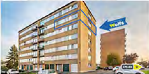
OUPEYE 160.000 €

Maison en plein centre (poss. habitat., burx, commerce, ...), 2 ch. (poss. +), 2 caves, DV, R.C. : 297 €, ch. gaz, PEB No. : 20150114022921, excellente situation !