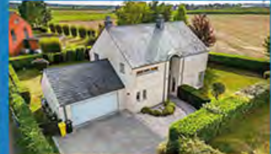
DALHEM 525.000 €

Charmante maison, 3 gdes ch., cuis. sup.-équ., liv. +/- 43 m 2 , jd aménagé, 2 gar., car-port, DV, rv ch. c., 39 pann. photov., PEB No. : 20220220033037, Impecc. !