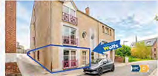
VAL-MEER (RIEMST) 800 € / mois

Maison, 3 ch., bur., cuis. s-équ., gd jardin +/- 1.191 m 2 , piscine chauffée, gar., sup. hab. : +/- 160 m 2 , R.C. : 315 €, PEB No. : 20230305008577, à découvrir !