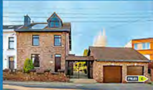
VOTTEM à pd. 419.000 €

Villa semi- indép., 4 ch., liv. +/- 43 m 2 avec cuis. équ., jardin, garage, sup. lot. : +/- 600 m 2 , DV, ch. c., alarme, PEB No. : 20201103023288, belle situation !