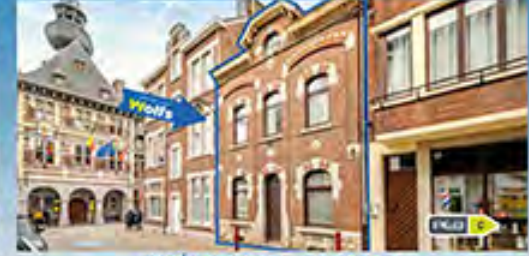
VISÉ (CENTRE) 159.000 €

FO à pd Maison, 3 ch., cuis. équ., beau jardin +/- 500 m 2 , espace parking couvert, R.C. : 334 €, DV, électr. OK, PEB No. : 20210825017663, vue sur les champs !