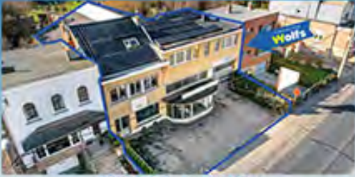
ROCOURT à pd. 550.000 €

Charmante villa de 2002 sur +/- 160 hab., 3 ch., liv. +/- 63 m 2 , cuis. équ., 2 sdb, jardin, 2 gar., alarme, airco, électr. OK, PEB No. : 20201126010651, Impecc. !