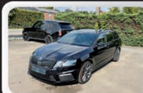
Skoda Octavia RS 2.0 TFSI 01/2018 79.425 km