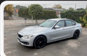
BMW 318d Automatique 04/2018 31.684 km