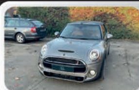
Mini Cooper S Cabriolet 09/2016 45.278 km