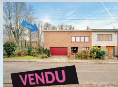
Allieur 235.000 €