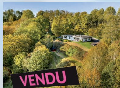
Wihogne 445.000 €