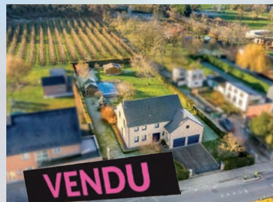
Oreye 255.000 €