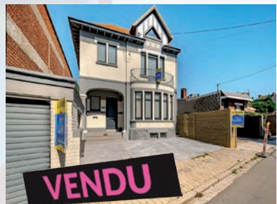
Lixhe (Loën) 235.000 €