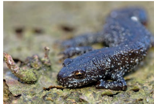
Sauvetage des batraciens

Et Sergé Tiquet d'ajouter : «Pour limiter les dégâts, nous conseillons également à tous d'éviter les routes concernées par les migrations ou d'y rouler à moins de 30 km/h afin d'éviter que les amphibiens ne soient aspirés et projetés contre les soubassements des véhicules.»