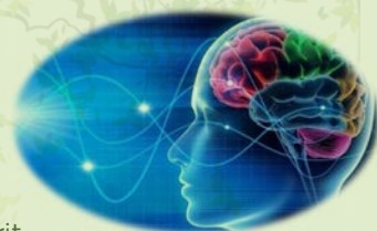
photo-neuro-stimulatrice qui améliore la synchronisation cérébrale permettant d'explorer une grande variété d'états de conscience. Puissante technologie créant un état d'esprit fiable et cohérent afin de reprendre contact avec votre nature, votre potentiel inexploré. Le voyage commence juste en fermant les yeux.