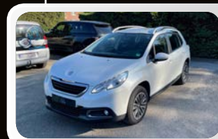
Peugeot 2008 1.2 Pure Tech Active S 10/2015 36.582 km

Les candidatures doivent être adressées par courrier postal ou par mail à l'adresse : john@jbautos.be