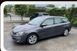
Peugeot 308 SW 1.2 Pure Tech Active STT 09/2016 51.888 km