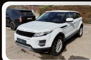
Land Rover Evoque 2.2 ED4 07/2012 140.058 km